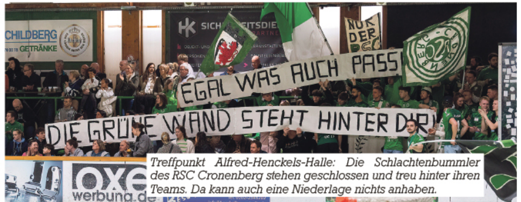
Treffpunkt Alfred-Henckels-Halle: Die Schlachtenbummler des RSC Cronenberg stehen geschlossen und treu hinter ihren Teams. Da kann auch eine Niederlage nichts anhaben.