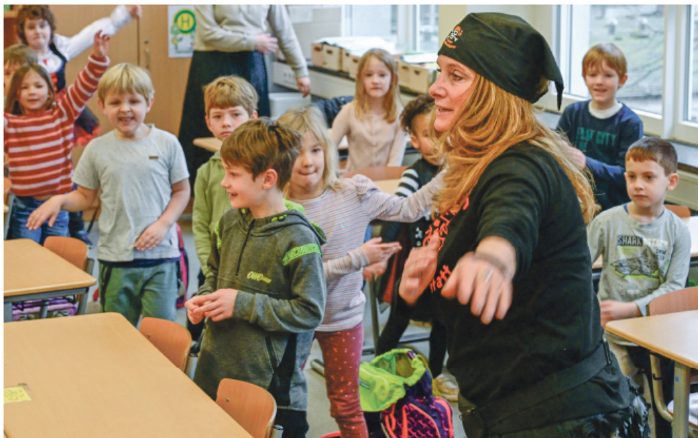
Die Kinderkochpiraten stärken das Bewusstsein für eine gesunde Lebensweise bereits in jungen Jahren – ohne erhobenen Zeigefinger, dafür nachhaltig und mit lachenden Kindergesichtern.“