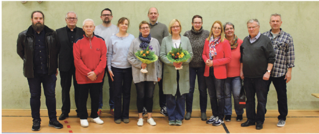
Auch in den Zeiten des Wandels eine starke Einheit - die Cronenberger Turngemeinde.