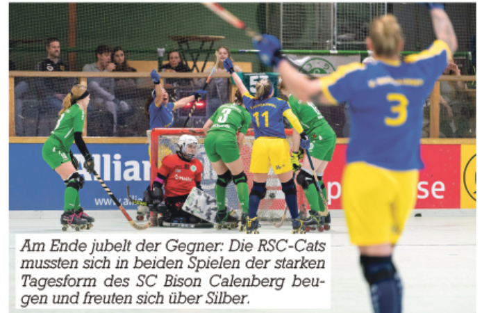
Am Ende jubelt der Gegner: Die RSC-Cats mussten sich in beiden Spielen der starken Tagesform des SC Bison Calenberg beugen und freuten sich über Silber.