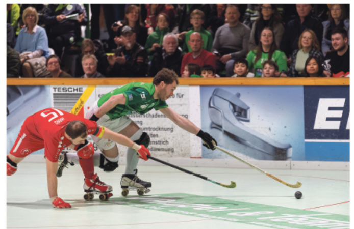
Lang und länger: Die RSC-Löwen haben sich gestreckt und alles gegeben, um den DRIV-Pokal der Herren 2024 zu holen. Am Ende aber hatten sie gegen die RESG Walsum das Nachsehen.

gab es so nur Silber für die Löwen, denen die Anstrengung des Finalwochenendes buchstäblich ins Gesicht geschrieben war.