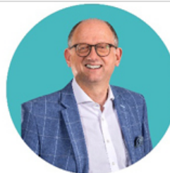
Rainer Spiecker Bürgermeister Stadtverordneter